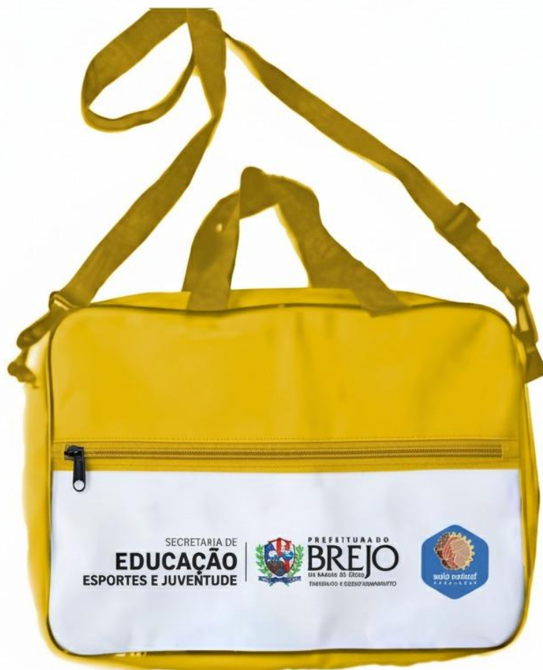
Figura 5 - Modelo de Pasta

BREJO da Madre de Deus TRABALHO E DESENVOLVIMENTO