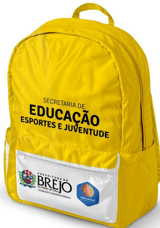
Figura 2- Modelo de Mochila

(imagens meramente ilustrativas, devendo seguir a descrição dos itens).