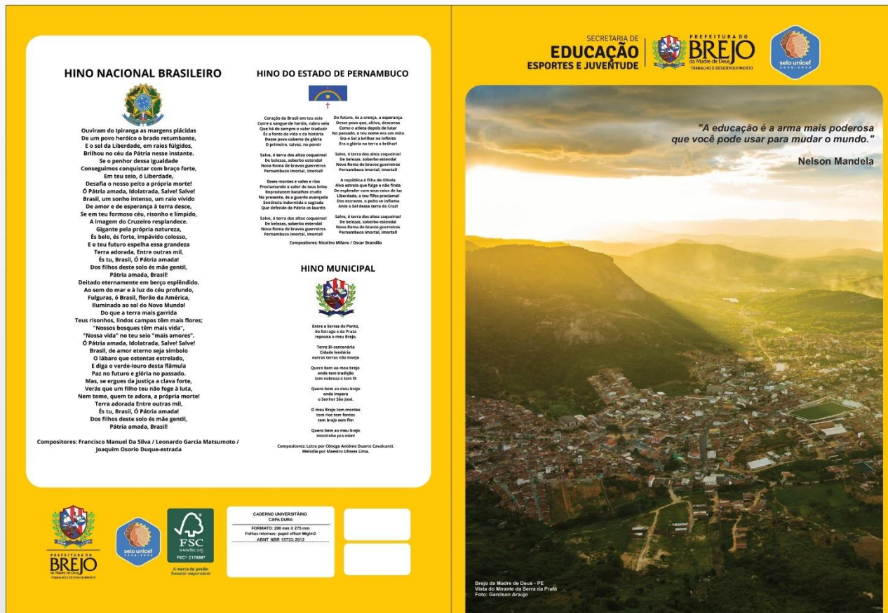
Figura 6 - Modelo de Caderno

Obs. O demais modelos dos cadernos e itens personalizados seguem em anexo.