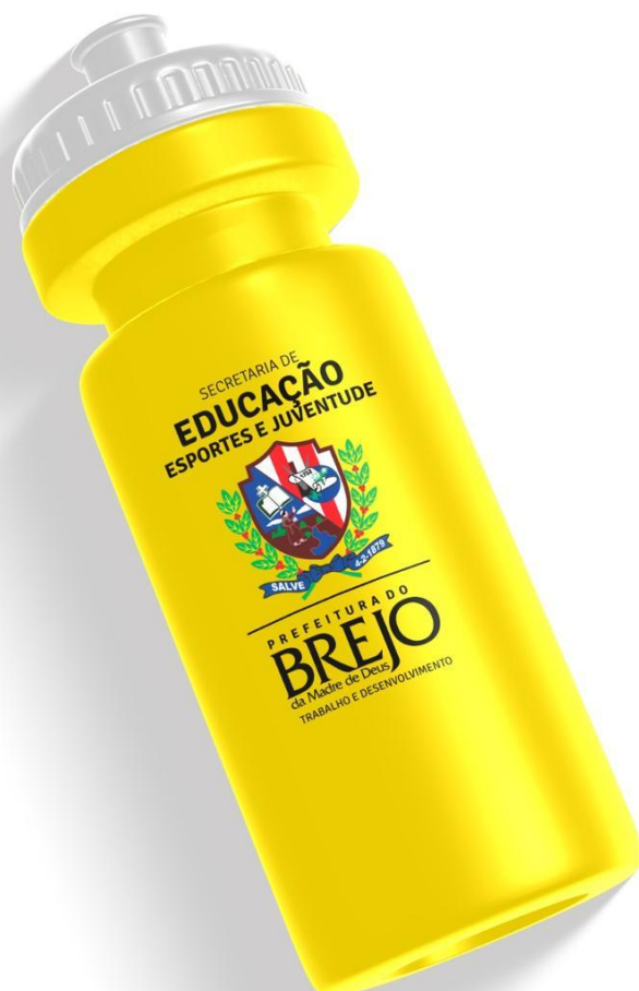
Figura 3 - Modelo de Garrafa Squeeze

PREFEITURA DO BREJO da Madre de Deus TRABALHO E DESENVOLVIMENTO