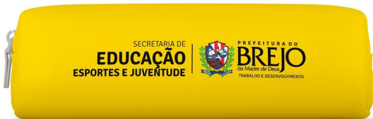
Figura 4 - Modelo de Estojo

P R E F E I T U R A D O BREJO da Madre de Deus TRABALHO E DESENVOLVIMENTO