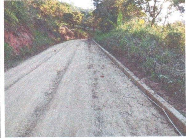
FOTO 4: LADEIRA ZE BUCHUDO - MEIO-FIO EM ANDAMENTO DA SEGUNDA LADEIRA;