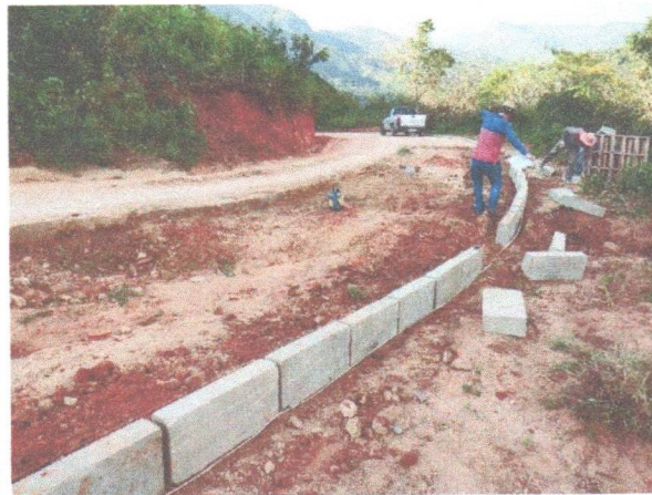
FOTO 3: LADEIRA ZE BUCHUDO - MEIO-FIO EM ANDAMENTO TRECHO NO FIM DA 1ª LADEIRA;